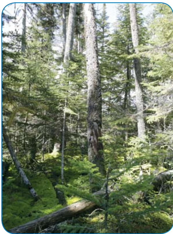
Dans une forêt rendue à maturité, les arbres commencent lentement à tomber au sol.

Un exemple intéressant que l'on peut donner à cet égard est la forêt de la réserve faunique des Laurentides. On se souviendra en effet que cette forêt a été lourdement affectée lors de la dernière épidémie de la tordeuse des bourgeons de l'épinette et que les arbres morts ou en dépérissement ont été récoltés sur de grandes parties de ce territoire. Pourtant, on y retrouve aujourd'hui une forêt en pleine santé.