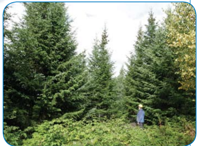
Le territoire que vous voyez ici a été récolté en 1983, c'est-à-dire il y a près de 25 ans. Il n'a pas fait l'objet de reboisement car la régénération naturelle était suffisante. Cette jeune forêt déjà dense fait place à plusieurs essences forestières, ce qui confirme la présence d'une régénération qui reflète bien la diversité de la forêt.

du terrain, ils réaliseront des travaux sylvicoles, tels le scarifiage, qui sert à préparer le sol en vue du reboisement, ou encore la plantation. Quelques années plus tard, ils pourront aussi effectuer des éclaircies forestières pour aider la forêt à mieux grandir.